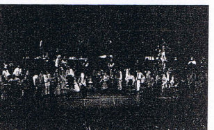
渋谷シティオペラ「カルメン」(3枚共)